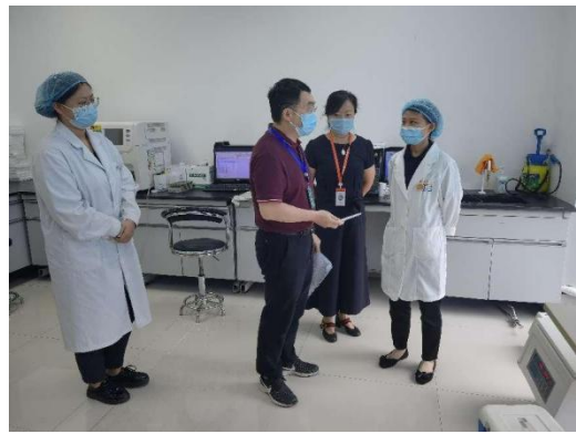
成都高新爱康国宾城南体检门诊部有限公司指导现场