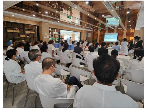
成都慈铭健康管理有限公司金沙遗址路体检门诊部指导现场